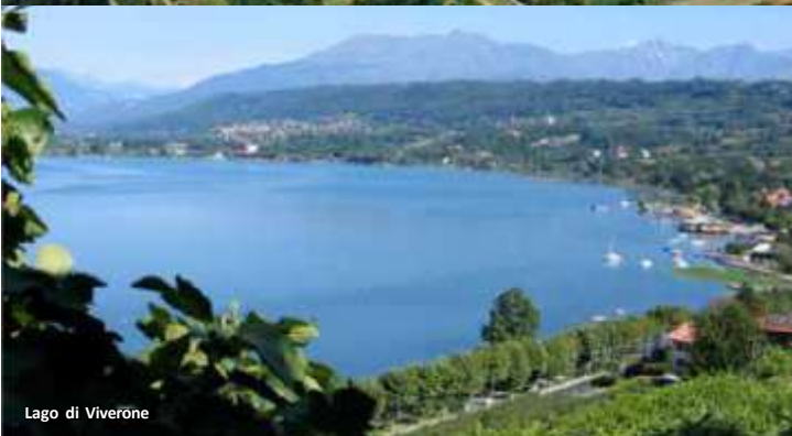
Lago di Viverone