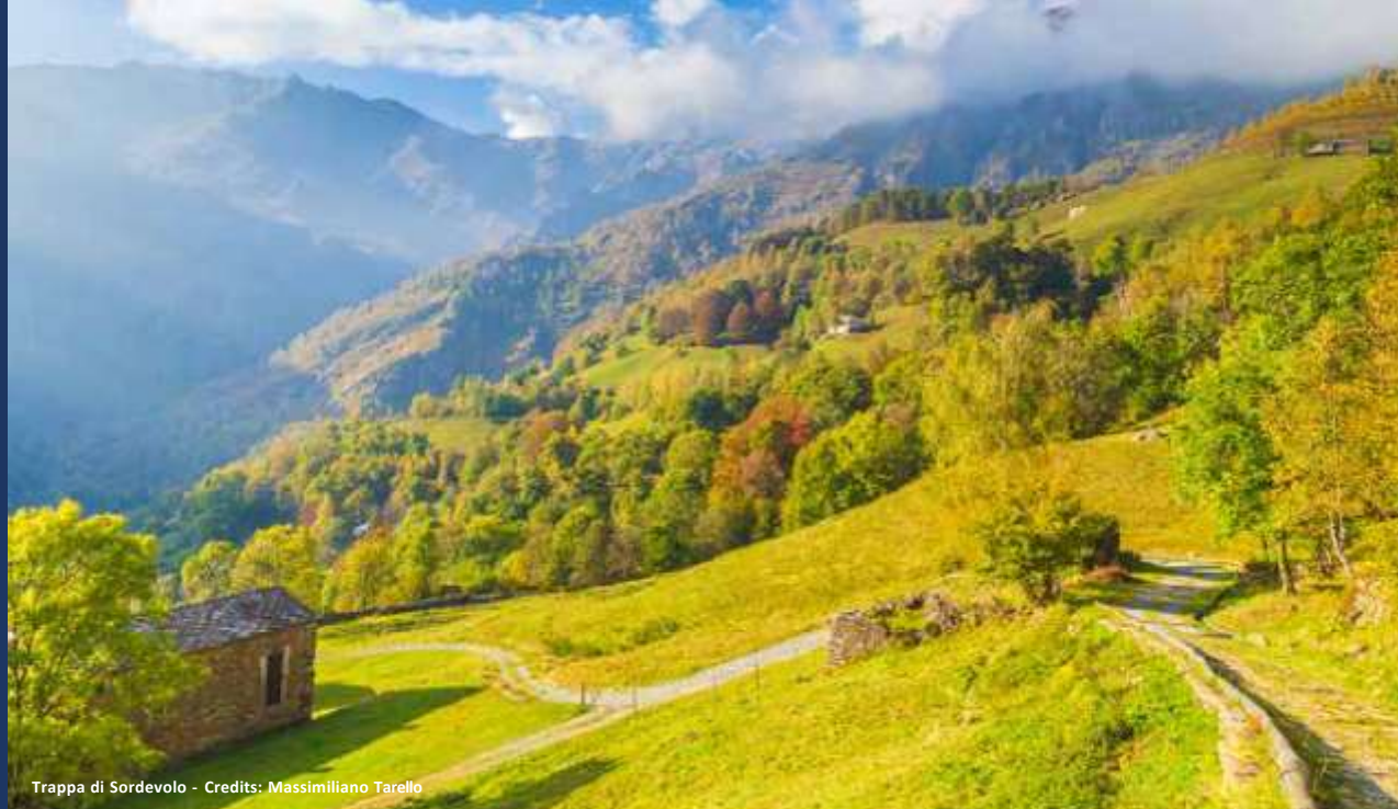
Trappa di Sordevolo - Credits: Massimiliano Tarello