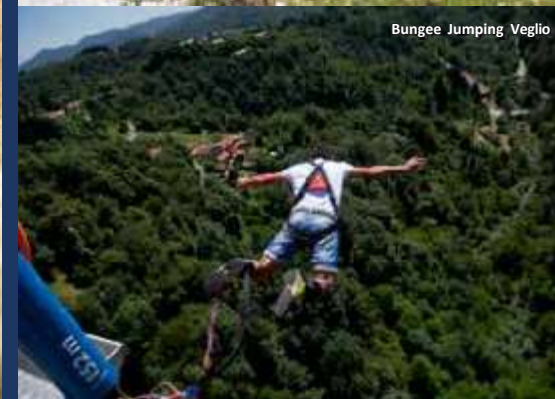
Bungee Jumping Veglio