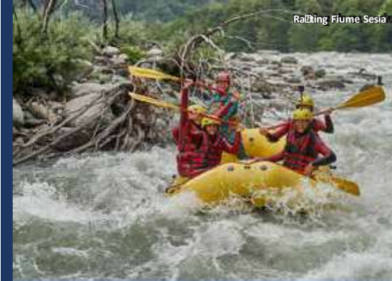
Rafting Fiume Sesia