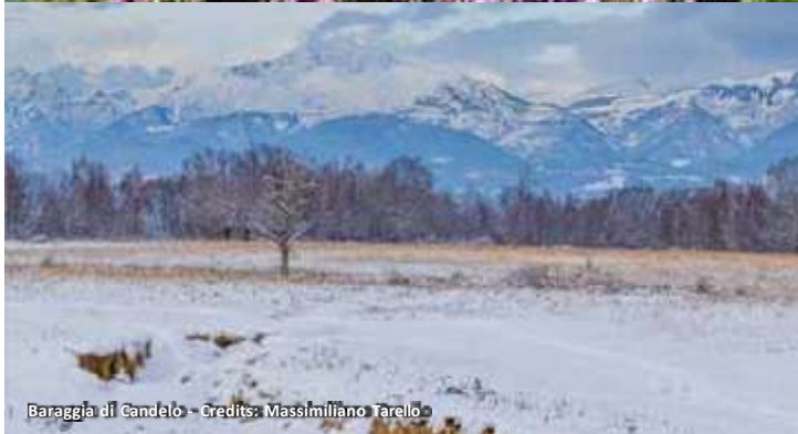
Baraggia di Candelo