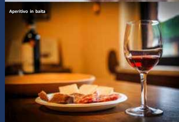
Aperitivo in baita