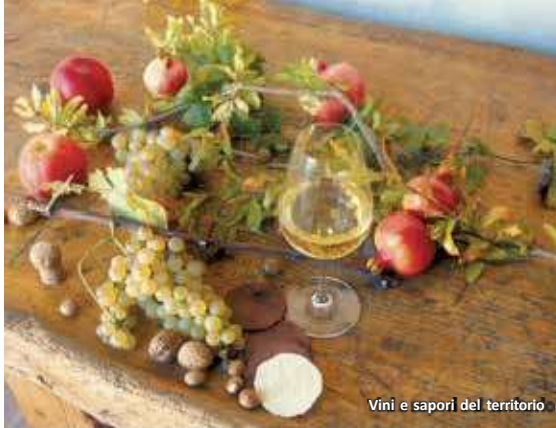
Vini e sapori del territorio