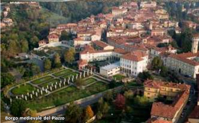
Borgo medievale del Piazza

I riconoscimenti UNESCO del territorio non si esauriscono con lo splendido Sacro Monte di Varallo, ma coinvolgono anche la zona del Biellese, in particolare con il Santuario e Sacro Monte di Oropa (situato a circa 1200 metri di altitudine) in un percorso “tra terra e cielo” alla scoperta della natura e del sacro; una scoperta che può proseguire con la visita agli altri tre importanti santuari alpini, luoghi di fede e interesse artistico: Santuario di Graglia, Santuario di San Giovanni di Andorno e Santuario della Brughiera , all’interno dei quali è possibile pernottare.