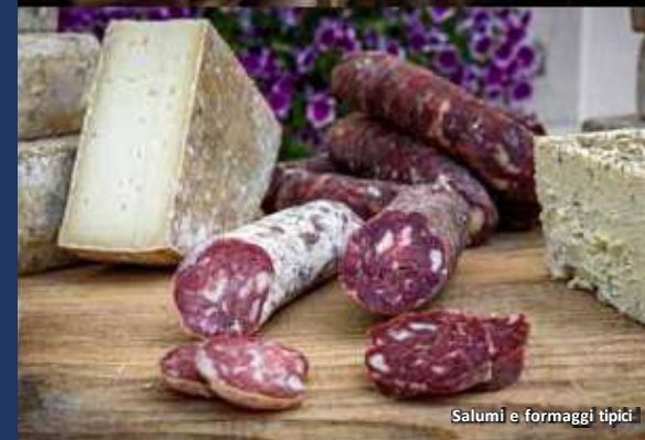
Salumi e formaggi tipici