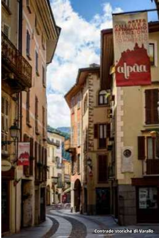
Contrade storiche di Varallo