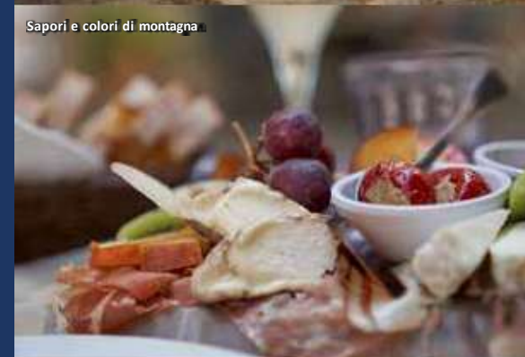
Sapori e colori di montagna