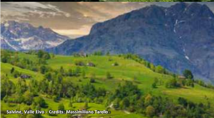
Salvine, Valle Elvo