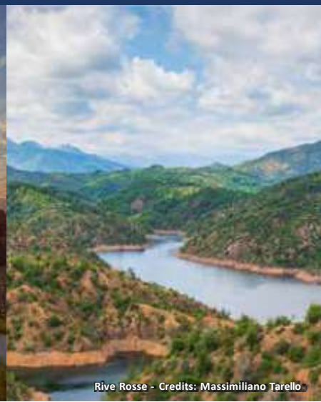
Rive Rosse