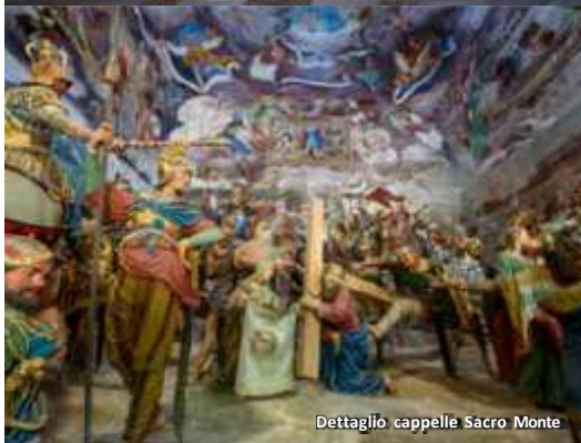
Dettaglio cappelle Sacro Monte