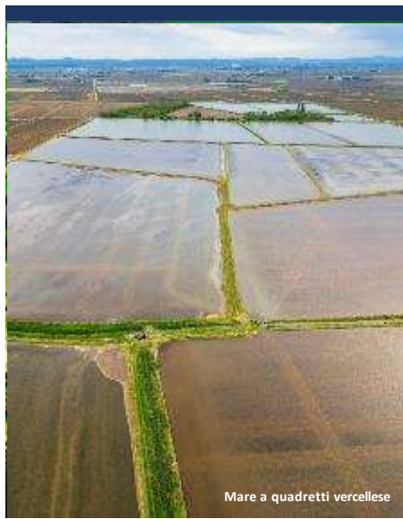
Mare a quadretti vercellese

Spostandosi verso il confine con la provincia di Biella, si viene accolti da un paesaggio davvero insolito: quello delle Rive Rosse (il cui nome deve l'origine al particolare colore del suolo), dove aree di bassa vegetazione, colline rocciose, calanchi e crinali si alternano a vigneti e piccoli corsi d'acqua.