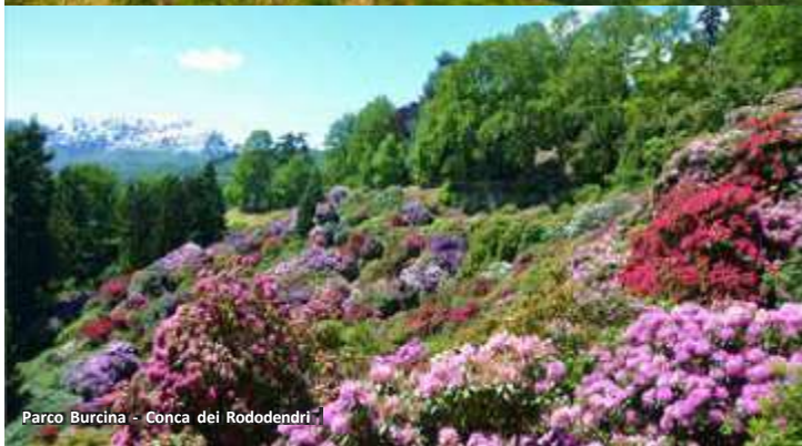
Parco Burcina - Conca dei Rododendri