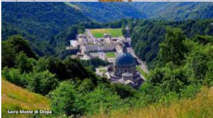
Sacro Monte di Oropa