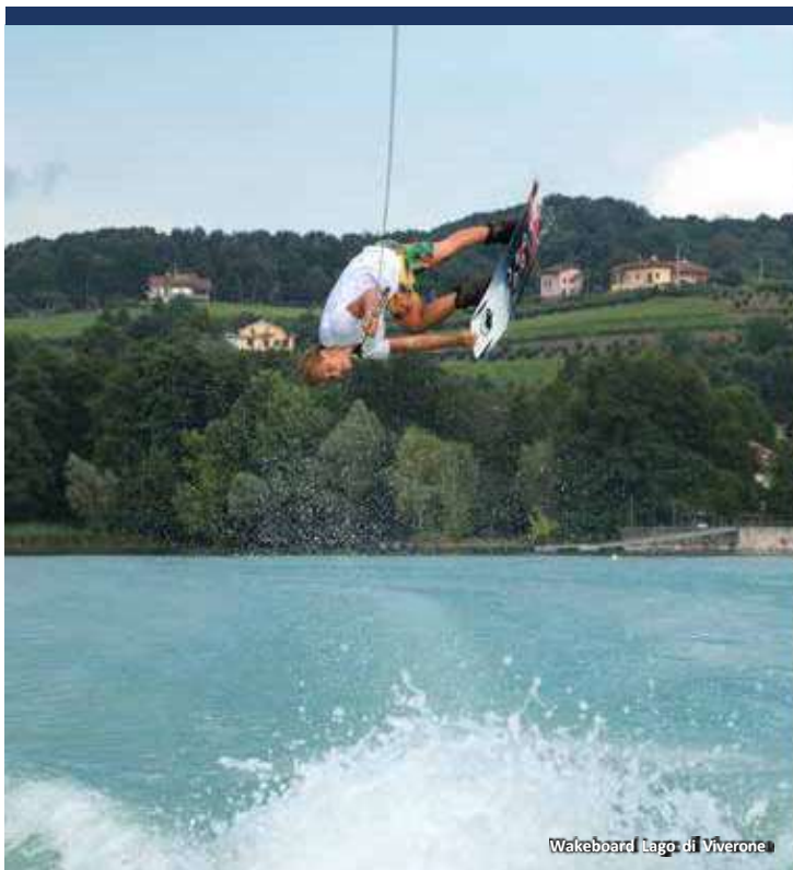
Wakeboard Lago di Viverone

Per gli amanti delle sfide e della competizione, il Biellese offre la possibilità di cimentarsi in un'ampia gamma di sport ed esperienze avvincenti: bungee jumping, parchi avventura, golf, sport aerei ed acquatici , questi ultimi in particolare presso il Lago di Viverone ma anche canyoning sul torrente Elvo ed è inoltre un territorio ideale per gli sport equestri : la grande varietà di ambienti, dalla pianura alle Alpi, lo rendono particolarmente adatto per splendide escursioni a cavallo attraverso riserve naturali, oasi naturalistiche, santuari e piccoli borghi.