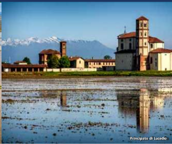
Principato di Lucedio