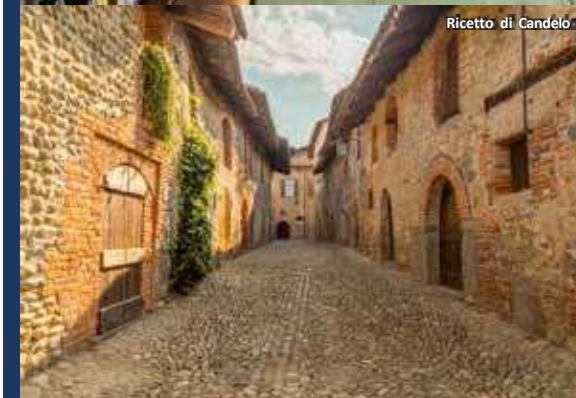
Ricetto di Candelo

Ecco che ancora una volta ambiente, religiosità, tradizione, arte, artigianato e impresa fanno da filo conduttore nel racconto di questi luoghi così ricchi di amore per la bellezza e per la cultura.