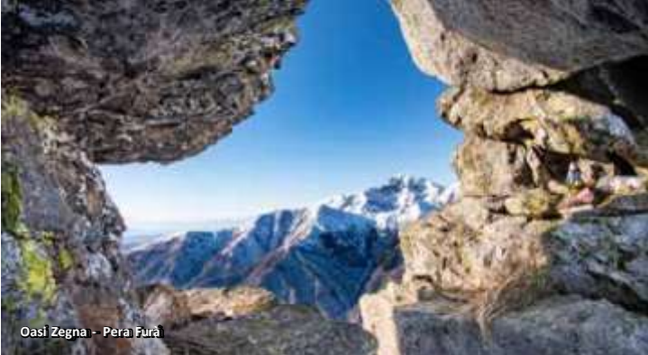
Oasi Zegna - Pera Fura