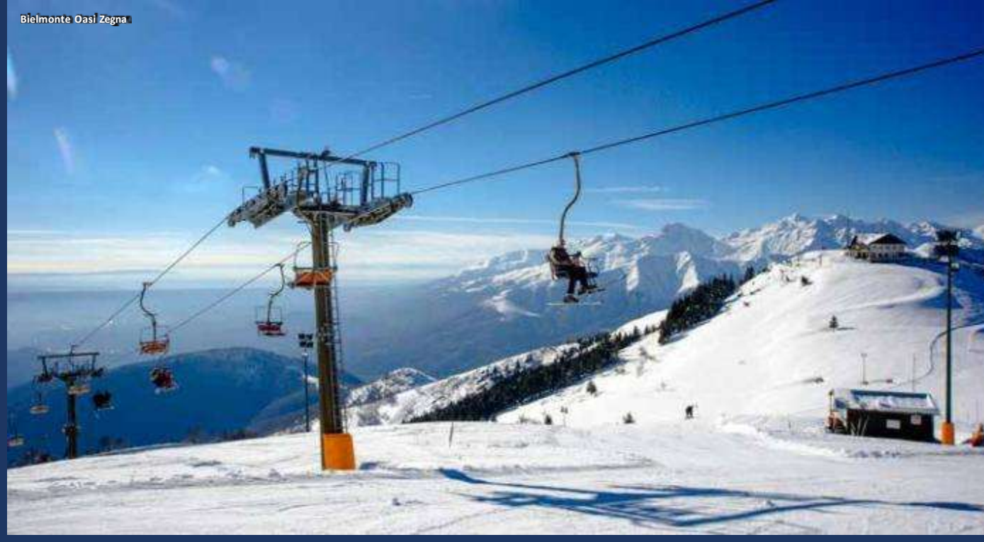
Bielmonte Oasi Zegna