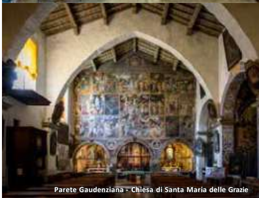
Parete Gaudenziana - Chiesa di Santa Maria delle Grazie