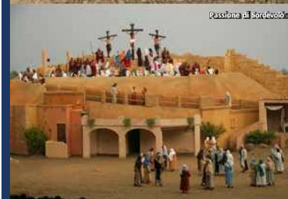
Passione di Sordevolo