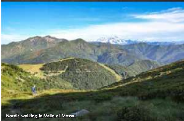
Nordic walking in Valle di Mosso