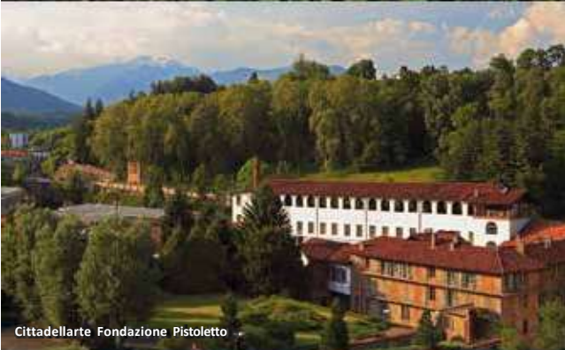
Cittadellarte Fondazione Pistoletto