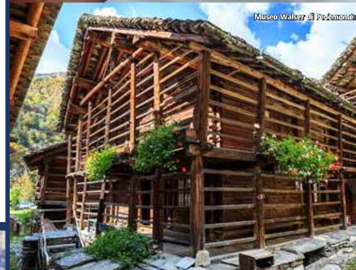
Museo Walser di Pedemonte