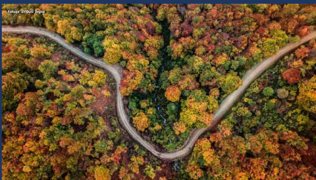
Foliage all'Oasi Zegna

L' Oasi Zegna infine, nata a partire dagli anni '30 su un progetto di valorizzazione del territorio per volere dell'imprenditore tessile Ermenegildo Zegna, si sviluppa in un'area montana di circa 100 kmq dove un'estesa rete sentieristica consente di entrare in contatto diretto con ambienti incontaminati.