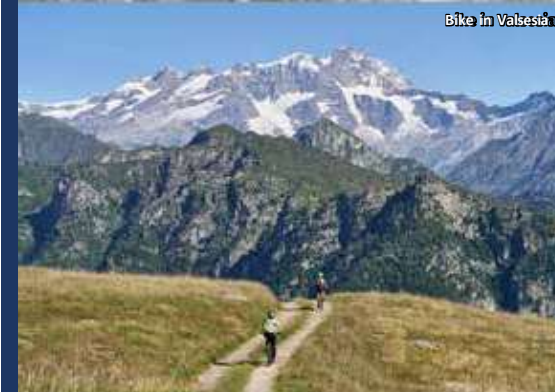
Bike in Valsesia