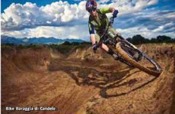
Bike Baraggia di Candelo