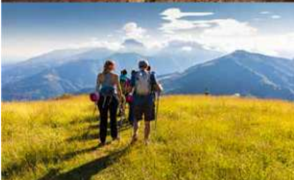
Trekking Oasi Zegna - Credits: Massimiliano Tarello