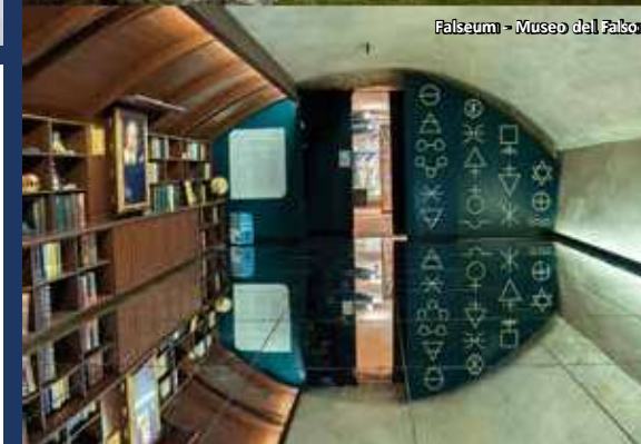
Falseum - Museo del Falso