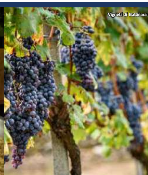
Vigneti di Gattinara