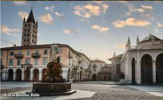
Piazza Duomo Biella