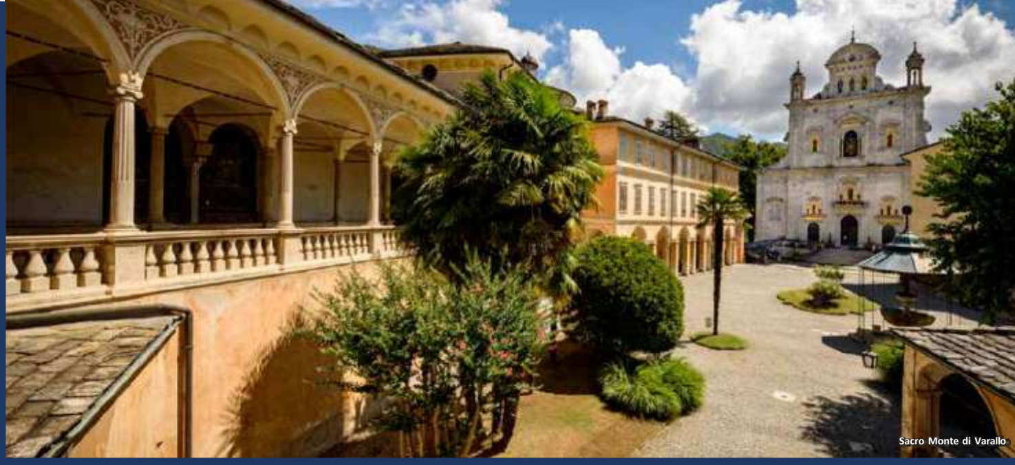
Sacro Monte di Varallo