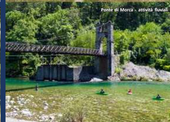
Ponte di Morca - attività fluviali