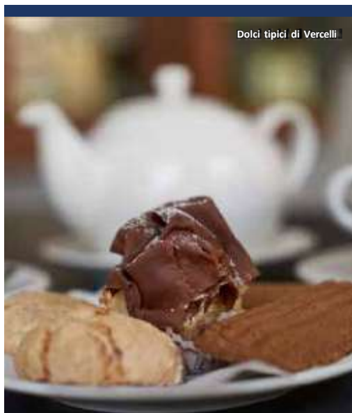
Dolci tipici di Vercelli

Sono le Terre del Nebbiolo , un vitigno dalla cui uva si ricavano vini rossi corposi e longevi, ma soprattutto vini che sanno sposarsi sapientemente con i piatti della tradizione. L'area collinare della provincia di Vercelli, compresa tra i comuni di Gattinara, Lozzolo e Roasio, produce alcuni dei vini rossi considerati tra i migliori d'Italia per qualità, delicatezza e armonia: si tratta del Gattinara DOCG , del Bramaterra DOC e del Coste della Sesia DOC .