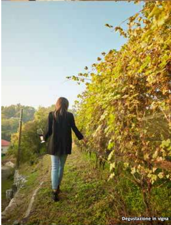
Degustazione in vigna