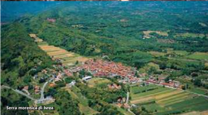
Serra morenica di Ivrea