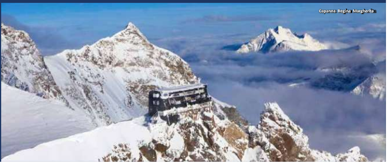
Capanna Regina Margherita

difficoltà all'alpinismo (una meta ambita è la Capanna Regina Margherita il rifugio più alto d'Europa), dall'arrampicata al parapendio fino alle tante alternative sulle due ruote, MTB e Trial tra tutti, e i diversi percorsi ciclabili che permettono di esplorare quasi interamente questo territorio da Alagna fino a Guardabosone.