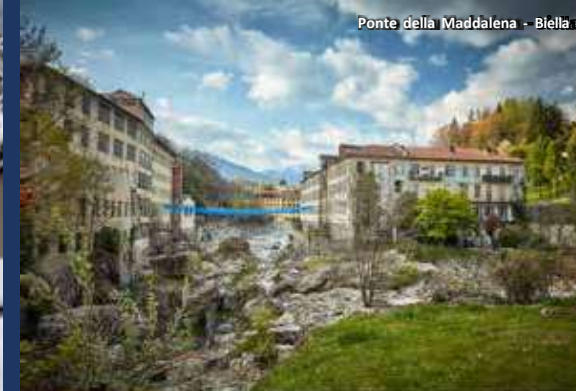
Ponte della Maddalena - Biella