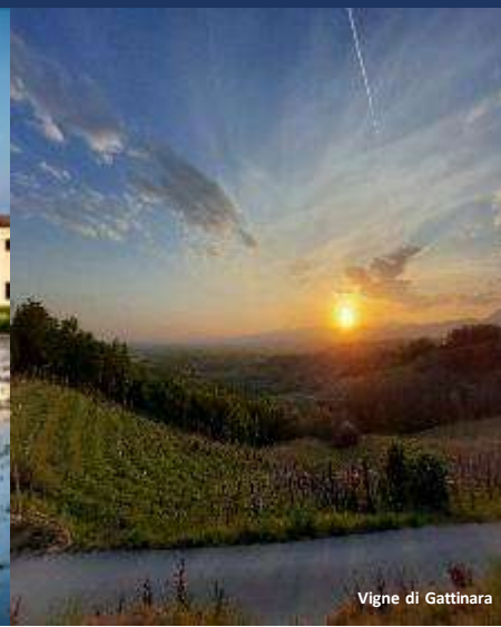
Vigne di Gattinara