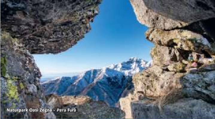
Naturpark Oasi Zegna - Pera Furà