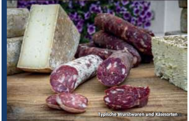
Typische Wurstwaren und Käsesorten