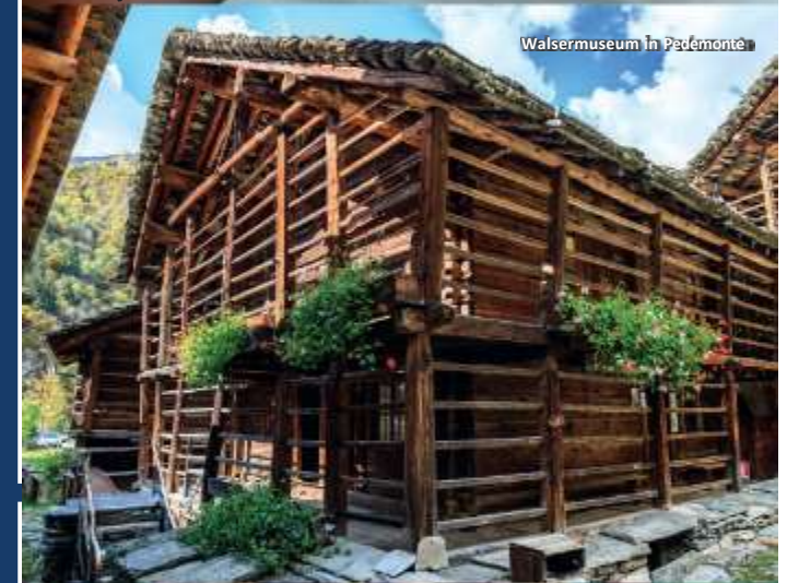
Walsermuseum in Pedemonte