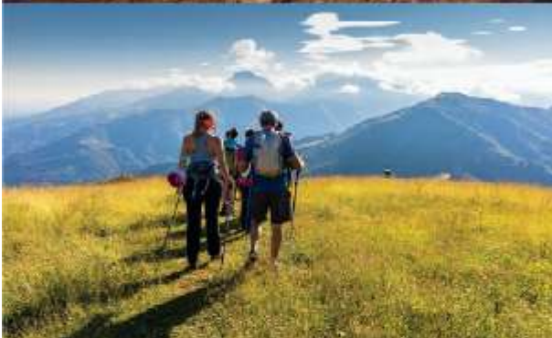
Trekking im Naturpark Oasi Zegna - Impressum: Massimiliano Tarello