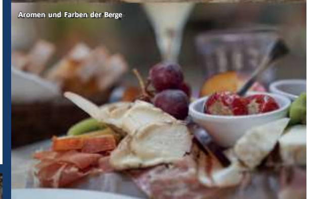
Aromen und Farben der Berge