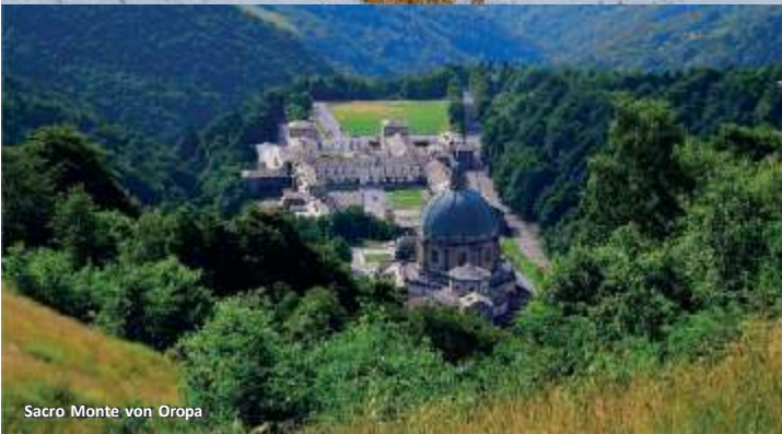
Sacro Monte von Oropa