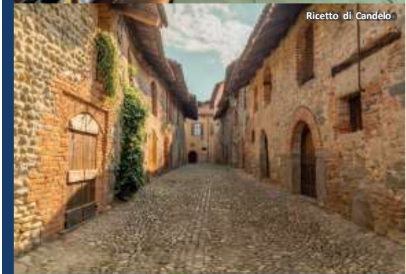
Ricetto di Candelo