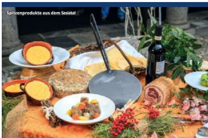
Spitzenprodukte aus dem Sesiatal