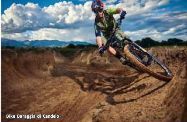
Bike Baraggia di Candelo