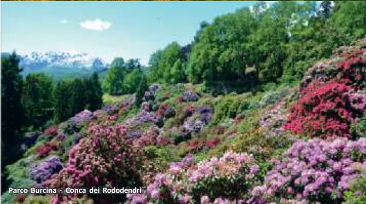
Parco Burcina - Conca dei Rododendri