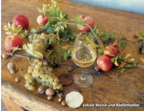
Lokale Weine und Köstlichkeiten