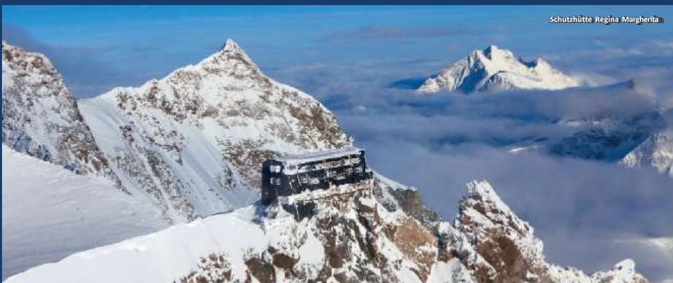
Schutzhütte Regina Margherita

Bergsteigen (ein beliebtes Ziel ist die Schutzhütte Regina Margherita , die höchstgelegene Schutzhütte Europas), Klettern, Paragleiten und zahlreiche Radsportmöglichkeiten, darunter MTB und Trial , und verschiedene Radwege, auf denen man fast das gesamte Gebiet von Alagna bis Guardabosone erkunden kann.