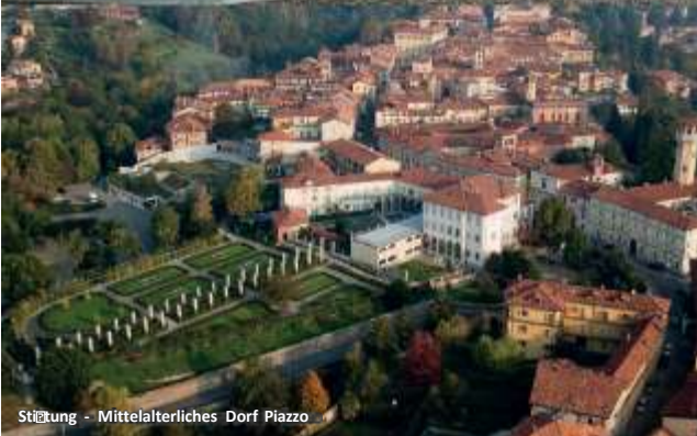
Städtebau - Mittelalterliches Dorf Piazza

Die Anerkennung des Gebiets seitens der UNESCO endet nicht mit dem herrlichen Sacro Monte von Varallo, sondern bezieht auch das Territorium von Biella und insbesondere die Wallfahrtskirche und den Sacro Monte von Oropa (auf einer Höhe von ca. 1.200 m) ein und lädt die Besucher zu einer Reise „zwischen Himmel und Erde“ und zur Entdeckung der Natur und des Heiligtums ein. Diese Reise kann mit einem Besuch der anderen drei bedeutenden alpinen Heiligtümer und Orte des Glaubens und der Kunst - der Wallfahrtsort Graglia, der Wallfahrtsort San Giovanni di Andorno und der Wallfahrtsort Brughiera - fortgesetzt werden, wo man auch übernachten kann.