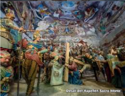
Detail der Kapellen Sacro Monte