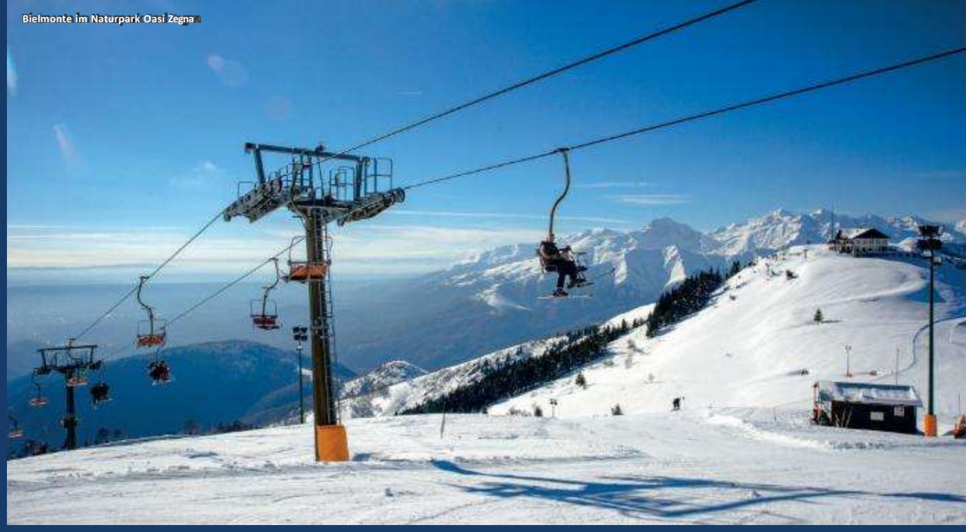
Bielmonte im Naturpark Oasi Zegna