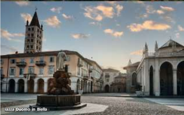
Piazza Duomo in Biella