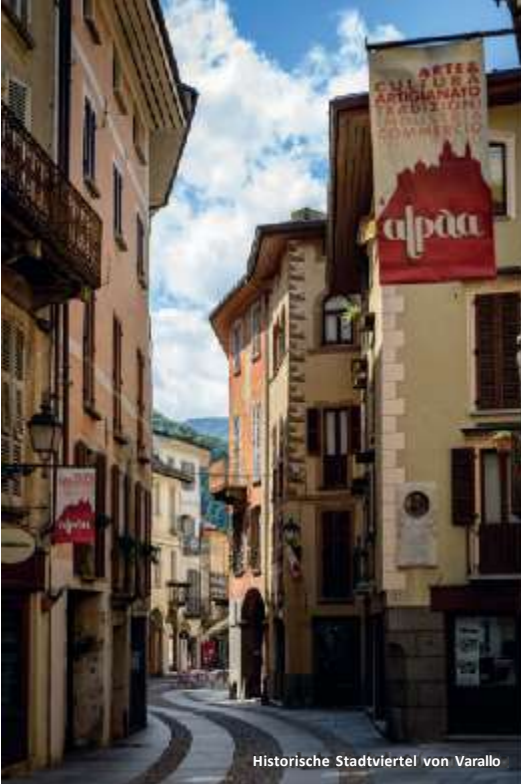
Historische Stadtviertel von Varallo