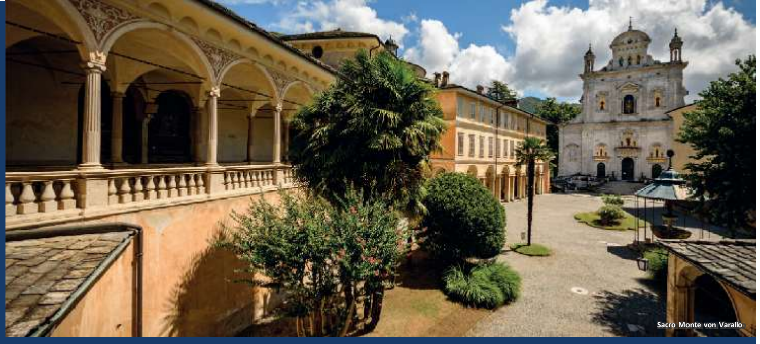
Sacro Monte von Varallo