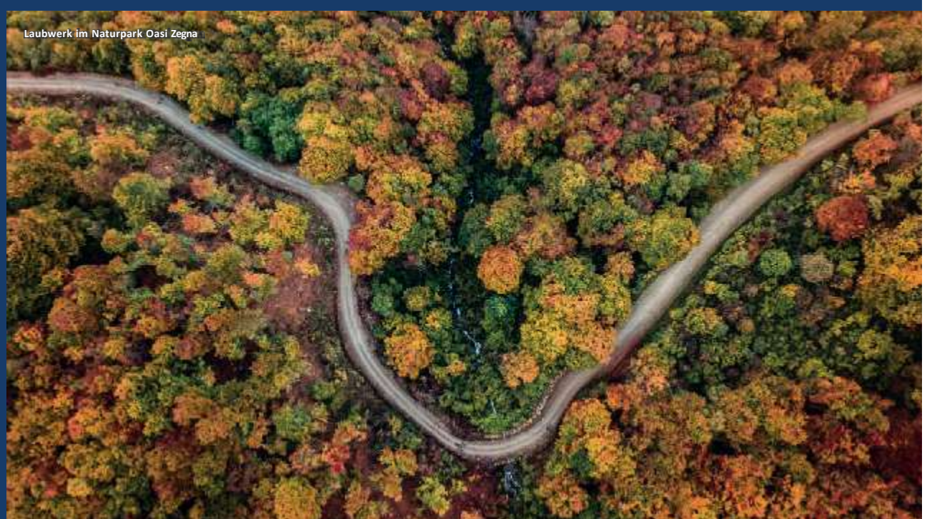
Laubwerk im Naturpark Oasi Zegna