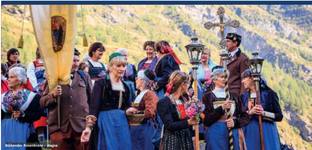
Blühender Rosenkranz - Alagna