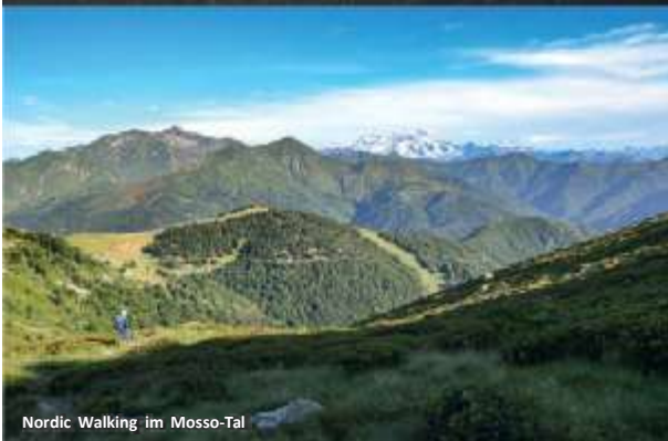
Nordic Walking im Mosso-Tal