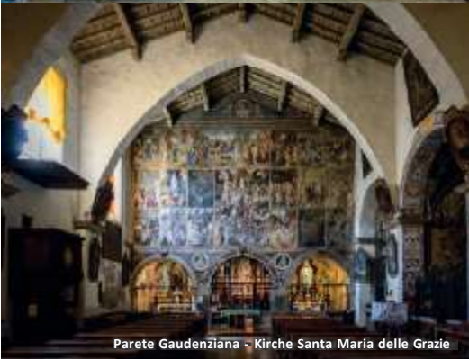
Parete Gaudenziana - Kirche Santa Maria delle Grazie