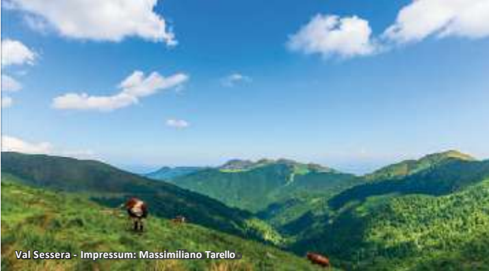
Val Sessera

Der Naturpark Oasi Zegna wurde in den 1930er Jahren im Rahmen eines Projekts zur Aufwertung des Gebiets im Auftrag des Textilunternehmers Ermenegildo Zegna angelegt. Er erstreckt sich über ein etwa 100 km 2 großes Berggebiet , in dem ein ausgedehntes Netz von Wanderwegen den direkten Kontakt mit unberührten Naturlandschaften ermöglicht.