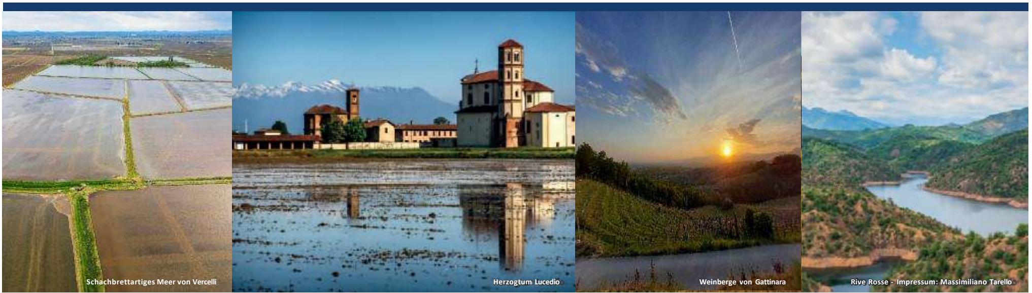
Schachbrettartiges Meer von Vercelli

Näher an der Grenze zur Provinz Biella wird man von einer wirklich ungewöhnlichen Landschaft namens Rive Rosse (deren Name sich von der besonderen Farbe des Bodens ableitet) empfangen, in der sich Bereiche mit niedriger Vegetation, felsige Hügel, Schluchten und Käme mit Weinbergen und kleinen Bächen abwechseln.