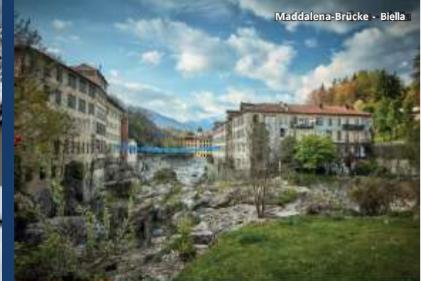
Maddalena-Brücke - Biella