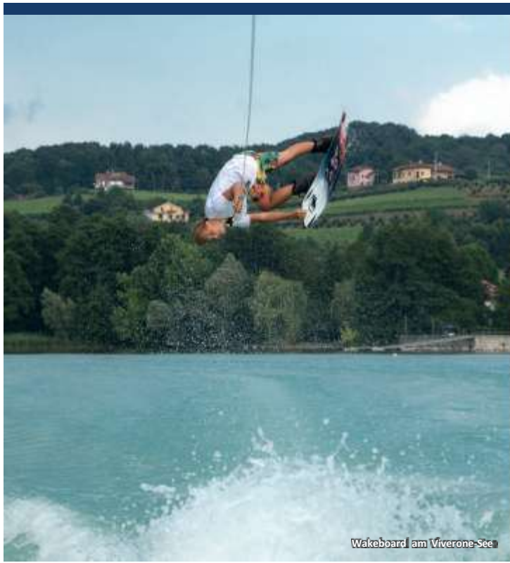
Wakeboard am Viverone-See