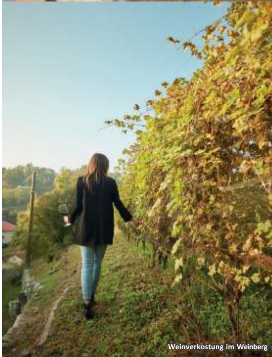
Weinverkostung im Weinberg