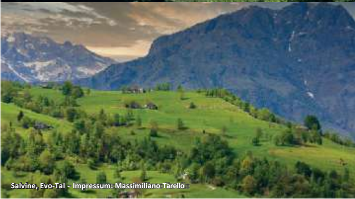
Salvine, Evo-Tal - Impressum: Massimiliano Tarello