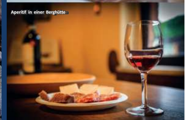
Aperitif in einer Berghütte