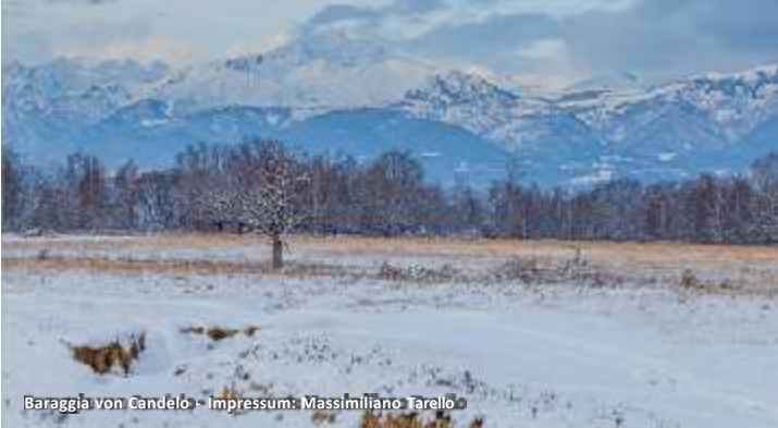
Baraggia von Candelo