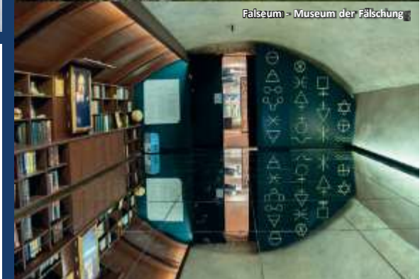
Falseum - Museum der Fälschung

Erneut bilden Umwelt, Religiosität, Tradition, Kunst, Handwerk und Unternehmertum den Leitfaden in der Geschichte dieser Orte, die eine besondere Liebe für Schönheit und Kultur haben.