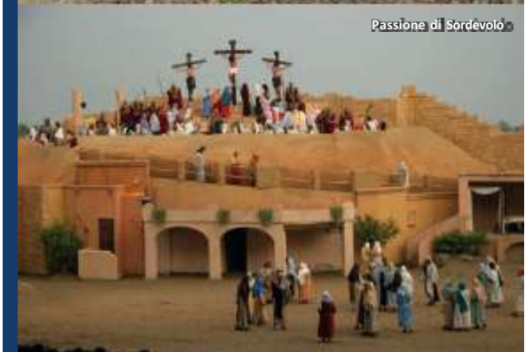
Passione di Sordevolo